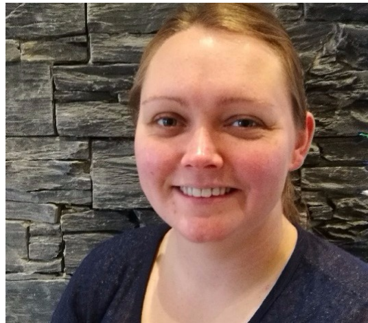
"Endelig er der kommet et program med basisviden om dansk svineproduktion til vores udenlandske kollegaer."